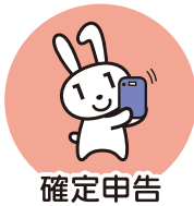
確定申告 (2024年度より)