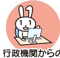
行政機関からの お知らせ・各種証明書