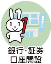
銀行・証券 口座開設