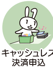
キャッシュレス 決済申込